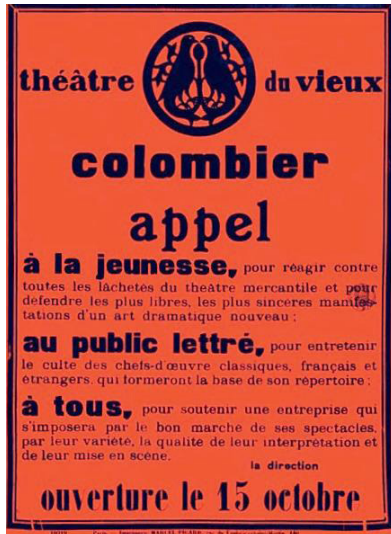
L'Appel de Copeau pour l'ouverture du Théâtre du Vieux-Colombier en 1913.

La troupe, épuisée mais poussée par le succès, conclut la saison par La Nuit des rois qui entre dans la légende par sa préparation et sa mise-en-scène, Copeau et Jovet travaillant durant quarante-huit heures d'affilée à l'éclairage. C'est un succès : le théâtre du Vieux-Colombier a imprimé sa marque par l'application des principes de son Appel, à travers l'affirmation esthétique d'un théâtre comme art total. La troupe a prouvé la qualité et l'efficacité de sa démarche d'investissement collectif, compensant l'indigence de ses moyens par un déploiement d'ingéniosité et d'énergie mis au service de l'œuvre.