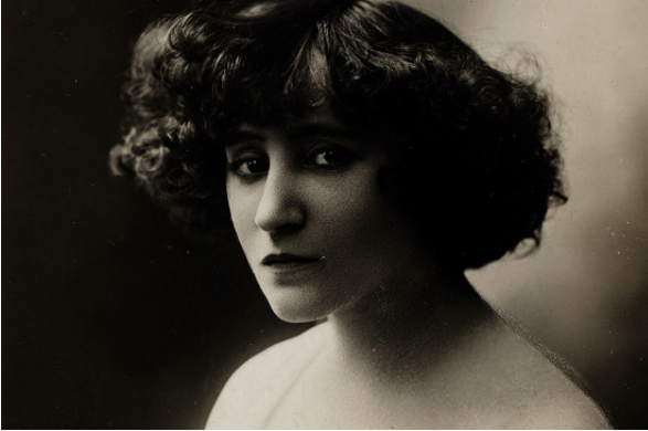
Colette dans les années 1900.

La mentalité n'était pas tellement différente de celle que décrit Colette dans L'envers du Music-hall et la Vagabonde .